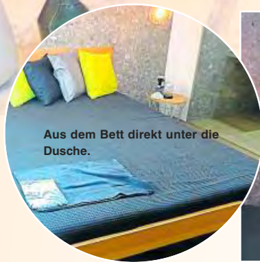
Aus dem Bett direkt unter die Dusche.